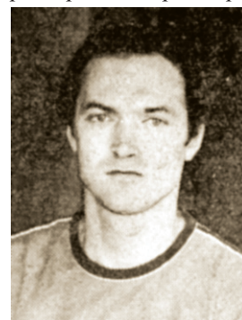
Ю. А. Савцилло

САВЦИЛЛО Юрий Аркадьевич (23.06.1951), хоккеист (нападающий), тренер, мастер спорта СССР. Воспитанник ХК «Вымпел» (Жуковский). Выступал в «Губкинце» (Москва) в 1968—1970, «Вымпеле» (Жуковский) в 1968/69, «Химике» (Воскресенск; 30.04.1972 в Челябинске в матче с командой «Трактор» забросил две шайбы) в 1969—1981, ЦСКА в 1974/75, СКА (Ленинград) в 1975/76. В 1981—1984 выступал за «Ижсталь» (Ижевск; 161 матч, 43 шайбы, 22 передачи). 29.09.1983 в Челябинске в матче с командой «Трактор» забросил одну шайбу. В 1986—1988 выступал за «СКИФ» (Москва). Чемпион СССР (1975), 3-й призер чемпионата СССР (1970), обладатель Полярного Кубка и Кубка звезд. Победитель юниорского чемпионата Европы. По окончании карьеры игрока работал тренером «Ижстали» в 1984—1986, главным тренером новочебоксарского «Сокола» в 1988/89.