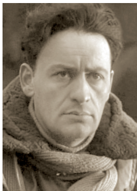
Н. К. Санишвили

народный артист Грузинской ССР (1964). В 1922 поступил на электромеханический факультет Тбилисского государственного университета, который окончил в 1925, одновременно с этим посещал киношколу при Госкинопроме Грузии, который также окончил в 1925. После окончания киношколы, снимался во многих фильмах. В мае 1930 выступал в Челябинске.