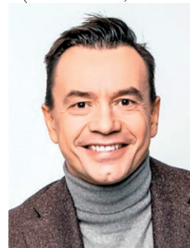
А. Б. Серов

СЕРОВ Алексей Борисович (15.11.1974, г. Иваново), российский певец. В начальных классах ивановской школы № 58 занимался в детском эстрадном ансамбле «А+Б», в кукольном театре. С 1997 солист группы «Дискотека Авария». В сентябре 1999 выступал в Челябинске (стадион «Центральный»). Лауреат премий «Песня года», «Золотой граммофон».