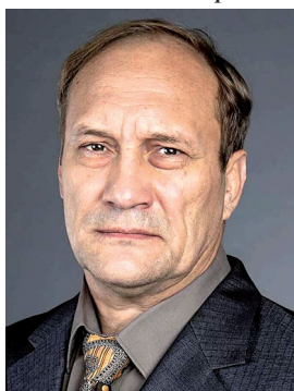
Е. В. Сидихин

СИДИХИН Евгений Владимирович (02.10.1964, Ленинград), советский и российский актёр театра и кино, телеведущий. С детства занимался вольной борьбой, пятикратный чемпион города. После школы учился на актёрском факультете Ленинградского государственного института театра, музыки и кинематографии, но был призван в Советскую Армию с первого курса в Туркестанском военном округе (в/ч 10858, г. Теджен). Принимал участие в боевых действиях в Афганистане. В ОКСВА проходил службу в составе в/ч 51931 — в танковом батальоне 101-го мотострелкового полка 5-й гвардейской Зимовниковской ордена Кутузова II степени мотострелковой дивизии (г. Герат). Уволился в запас в 1985, был восстановлен в институте. С 1989 до середины 1990-х играл в БДТ им. Г. А. Товстоногова. В 1999—2000 вёл на канале НТВ программу «Двое», в 2012 ведущий документальной программы НТВ «Крутые нулевые». Театральные работы: «Дикарь» — Пабло; «Старик» — Бычин; другие спектакли. Роли в кино: «Воин» (1987), «Прорва» (1991), «Дети чугунных богов» (1993), «Волчья кровь» (1995), «Ретро втроем» (1998), «Барак» (1999, фильм снимался в 1997—1998 в Сатке), «Ковчег» (2002), «Таксист» (2003), «Стая» (2005), «Расплата» (2007), «Станица» (2012), «такая работа» (2016), «Гранд» (2018) и другие фильмы. Лауреат Государственной премии России в области литературы и искусства (2000).