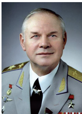
А. П. Силантьев

СИЛАНТЬЕВ Александр Петрович (23.08.1918, Екатеринбург — 10.03.1996, Москва), советский военачальник, маршал авиации (1976), Герой Советского Союза (1941), лауреат Государственной премии СССР (1977). Окончил 7 классов средней школы. С 1934 работал слесарем на заводе «Металлист» в Свердловске. Одновременно занимался авиационным спортом: с сентября 1935 инструктор-планерист в Первоуральской планерной станции, с апреля