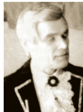
А. С. Соколов

СОКОЛОВ Алексей Сергеевич (23.10.1929, Москва — 29.03.1999, там же), советский и российский цирковой артист, дрессировщик лошадей, наездник, педагог, режиссёр, народный артист РСФСР (1988). После Великой Отечественной войны участвовал в кавалерийском клубе в Сокольниках. В 1947 был призван в Советскую Армию, окончил Высшую офицерскую кавалерийскую школу и был направлен на курсы тренеров-наездников.