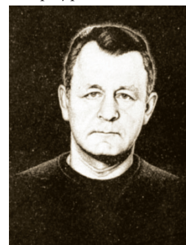
С. Ф. Солодухин

СОЛОДУХИН Сергей Фёдорович (18.08.1949, Ленинград — 1999, Санкт-Петербург), советский хоккеист, брат В. Ф. Солодухина. С тринадцати лет играл в хоккей, выступал за команду местного мясокомбината. С 1966 по 1977 был игроком основного состава ленинградского СКА. В чемпионатах СССР провел 322 матча, забросил 123 шайбы. 17.01.1971 в Челябинске в матче с командой «Трактор» забросил одну шайбу. Выступал за юношескую сборную СССР, в 1970 сыграл 3 матча в составе основной команды на кубке «Известий». После завершения карьеры игрока работал экспедитором на Ленинградском мясокомбинате. 15.01.2004 был включён в Зал хоккейной славы питерского СКА.