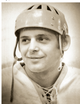
В. Ф. Солодухин

СОЛОДУХИН Вячеслав Фёдорович (11.11.1950 — декабрь 1979), советский хоккеист, мастер спорта международного класса. Начинал путь в хоккее как защитник, играл за клуб «Ленмясокомбинат». С 1964 в юношеской хоккейной команде СКА (Ленинград). В 1967—1979 был игроком основного состава ленинградского СКА. В чемпионатах СССР провел 432 матча, забил 147 шайб. Участник Суперсерии СССР — Канада (1972). Спортивные достижения: бронзовый призёр чемпионата СССР — 1971; финалист розыгрыша Кубка СССР — 1968 и 1971; серебряный призёр чемпионата мира и Европы (1972) в Праге (в ЧМЕ провёл 8 матчей, забил 5 голов). 28.02.1979 и 21.09.1979 в Челябинске в матчах