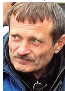
Н. П. Стамбула

Лит.: Летопись Магнитогорского металлургического комбината / сост. Н. Г. Пукаляк, Т. В. Фатина. — Магнитогорск, 2002.