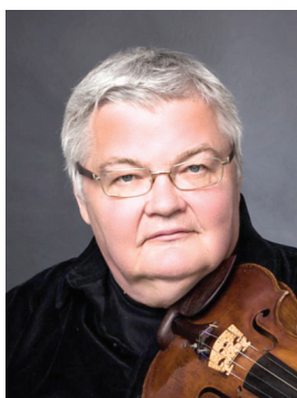
С. В. Стадлер