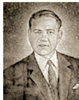
Т. И. Тетерин

ТЕТЕРИН Трофим Иванович (28.04.1909 — 11.09.1999, Москва), артист, заслуженный деятель культуры РФ (1996). Артист Москонцерта. В октябре 1983 выступал в Челябинске с литературным концертом (Б. Васильев «Не стреляйте в белых лебедях»).