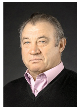
В. И. Трунов

ТРУНОВ Владимир Иванович (01.08.1950), советский хоккеист, российский хоккейный тренер, мастер спорта СССР международного класса. В возрасте десяти лет поступил в ДЮСШ ЦСКА. В сезоне 1967/68 впервые сыграл за основной состав ЦСКА, но закрепился в составе не сразу, выступая в первые годы за молодежный состав и за фарм-клуб армейцев — «Звезду» (Чебаркуль). С 1970 был основным игроком ЦСКА, в его составе трижды (1971, 1972, 1973) становился чемпионом СССР, а в 1974 стал вторым призёром чемпионата. В 1973 стал обладателем Кубка СССР. Обладатель Кубка европейских чемпионов (1971, 1972, 1973). После ухода из ЦСКА выступал за СКА (Ленинград), «Спартак» (Москва), «Химик» (Воскресенск), «Металлург» (Череповец). В 1976 в составе «Спартака» стал чемпионом СССР. 10.10.1978 и 21.03.1980 в Челябинске в матчах с командой «Трактор» забросил по одной шайбе. Всего в высшей лиге провёл свыше 270 матчей и забил 77 шайб в ворота. Выступал за вторую сборную СССР. В 1984 завершил игровую карьеру и перешёл на тренерскую работу. Работал начальником, тренером, главным тренером команды ЦСКА-2 (Москва), затем детским тренером в московских ДЮСШ ЦСКА и «Созвездие». Отмечен знаком «За заслуги в развитии физической культуры и спорта» (2001).