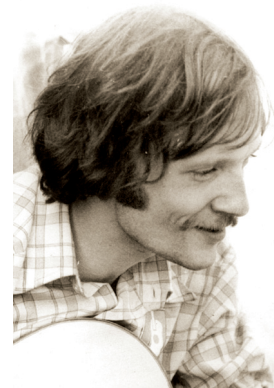
В. Б. Федоров

ФЁДОРОВ Юрий Иванович (08.06.1949, Ульяновск), советский хоккеист (защитник), заслуженный мастер спорта СССР (1978), тренер. В Ульяновске начал участвовать в чемпионатах СССР по хоккею в классе «Б» в команде «Торпедо». В 1969 был зачислен в состав хоккейной команды ЦСКА, но за сезон провёл всего 2 матча в её составе и был отправлен в Чебаркуль в местную команду «Звезда». Через год переведен в «Торпедо» (Горький). 20.08.1972 в Челябинске в матче с командой «Трактор» забросил одну шайбу. В чемпионатах СССР провёл 606 матчей и забросил 102 шайбы. За сборную СССР провёл 16 матчей, забросил 1 шайбу. В 1985—1987 работал тренером-консультантом в «Одзи сейси» (Томакомай, Япония). С 1988 — тренер, главный тренер нижегородского «Торпедо».