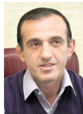
А. Х. Хамхоев

ХАМХОЕВ Али Хамитович (26.12.1965), советский дзюдоист, призёр чемпионатов СССР (1985, (соревнования проводились в Челябинске), 1988 — 2-е место; 1983, 1987, 1990 — 3-е место), победитель Игр доброй воли (1986), мастер спорта СССР международного класса. Вице-президент Федерации дзюдо Казахстана, государственный тренер Казахстана по дзюдо. Победитель первенства Европы среди юниоров (1984) в Испании.