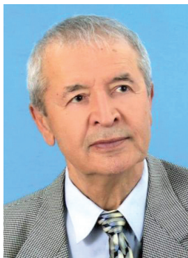
З. В. Хакназаров

ХАКНАЗАРОВ Захид Вахидович (12.11.1937, Ташкент — 18.07.2019, Анталия, Турция), советский и узбекский дирижёр, музыкальный педагог, общественный деятель, народный артист Узбекской ССР (1978). Окончил Московскую консерваторию (1963), ученик Н. Аносова. В 1965 возглавил симфонический оркестр Узбекской государственной филармонии и руководил им до 1979. В 1981—1984 ректор Ташкентской консерватории. В апреле 1984 выступал в Челябинске (фестиваль «Уральские зори»). В 1988 был одним из основателей оппозиционной узбекской политической партии Бирлик харакати, некоторое время был её председателем. Погиб в результате несчастного случая. Лит.: Торжественный аккорд // ВЧ. 1984. 3 апр.; День музыки для студентов // ВЧ. 1984. 5 апр.