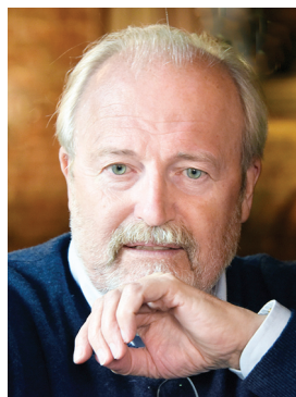
В. И. Хотиненко