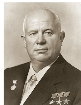
Н. С. Хрущёв

ХРУЩЁВ Никита Сергеевич (15(03).04.1894, с. Калиновка Ольховской волости Дмитриевского уезда Курской губ., ныне Хомутовский район Курской обл. — 11.09.1971, Москва), советский государственный деятель, Герой Советского Союза (1964), трижды Герой Социалистического Труда (1954, 1957, 1961), Герой НРБ (1964). Зимой посещал церковно-приходскую школу, летом работал пастухом. С девяти лет работал в поле. В 1908 с семьёй