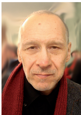
В. Н. Чекасин