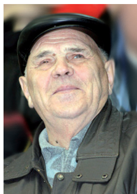
И. Б. Чистовский

ЧИСТЯКОВ Сергей Алексеевич , популярный чтец, заслуженный артист РСФСР (1989). Вел музыкальные программы. В его репертуаре про-