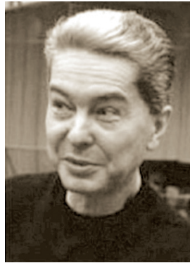
Б. В. Бланков

БЛАНТЕР Матвей Исаакович (10.02(28.01).1903, г. Почеп Черниговской губ. — 27.09.1990, Москва), советский композитор, член Союза композиторов СССР, народный артист РСФСР (1965), СССР (1975), заслуженный деятель ис-