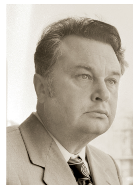
О. Н. Шестинский

(22.01.1880, имение Аламово Могилевской губ., ныне территория Александровского сельсовета Сенненского района Витебской обл., Республика Беларусь — 16.01.1954, Пермь), артист оперы (бас), заслуженный артист РСФСР (1934). По окончании Могилевского реального училища в 1900 поступил в Киевский политехнический институт на агрономическое отделение, но в 1905 был уволен из-за участия в забастовке.