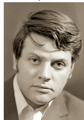
А. А. Ширвиндт