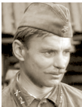
В. Д. Ячминский

ЯЧМИНСКИЙ Владимир Дмитриевич (15.06.1936, г. Харьков, УССР), актер театра, народный артист Украины (1996). Окончил студию при Львовском украинском драматическом театре им. М. К. Заньковецкой (1961). С 1961 — актер Тернопольского украинского музыкально-драматического театра. В июне 1985 выступал в Челябинске (спектакль «Тарас Бульба»).