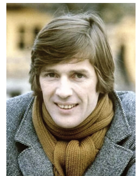
А. Г. Абдулов

АБДУЛОВ Александр Гаврилович (29.05.1953, г. Тобольск Тюменской обл. — 03.01.2008, Москва), советский и российский актёр театра и кино, кинорежиссёр, народный артист РСФСР (1991). Впервые на театральную сцену вышел ещё в пятилетнем возрасте в спектакле «Кремлёвские куранты» Ферганского драматического театра. Учился на факультете физкультуры Ферганского государственного педагогического института. Одновременно работал в театре рабочим сцены. Окончил ГИТИС (курс И. М. Раевского). С 1975 в труппе Московского театра имени Ленинского комсомола. Театральные работы: 1975 — «В списках не значился» Б. Васильева; режиссёр М. Захаров — лейтенант Плужников; 1976 — «Звезда и смерть Хоакина Мурьеты» А. Рыбникова; режиссёр М. Захаров — Хоакин; 1976 — «Гамлет» У. Шекспир; режиссёр А. Тарковский — Марцелл; 1979 — «Жестокие игры» А. Арбузова — Никита; 1981 — «Юнона и Авось» А. Рыбникова; режиссёр М. Захаров — Фернандо Лопес, Человек театра, пылающий еретик; 1983 — «Оптимистическая трагедия» Вс. Вишневского — Сиплый; 1984 — «Дорогая Памела» Дж. Патрика; 1986 — «Диктатура совести» М. Шатрова — Верховенский; 1986 — «Гамлет» У. Шекспир; режиссёр Г. Панфилов — Лаэрт; 1989 — «Поминальная молитва» Г. Горина — Менахем-Мендл; 1990 — «Школа для эмигрантов» Д. Липскерова — Трубецкой; 1997 — «Варвар и еретик» (по «Игроку» Достоевского) — Алексей Иванович; другие спектакли. В мае 1991 выступал