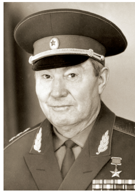
А. С. Бурдейный

БУРДЕЙНЫЙ Алексей Семёнович (18.10.1908, Житомир — 21.04.1987, Москва), советский военный деятель, генерал-полковник (1961), Герой Советского Союза (1945), почетный гражданин Минска. После окончания рабфака работал на предприятиях города Житомира. В 1928 вступил в ряды ВКП(б). В июне 1931 был призван в ряды РККА и направлен на учёбу в Саратовское бронетанковое училище, после окончания которого в марте 1932 назначен на должность командира взвода в составе механизированной бригады им. К. Б. Калиновского (Московский военный округ), в октябре 1933 — на должность старшего автотехника аэропорта Монино, в сентябре 1935 вернулся в бригаду им. К. Б. Калиновского, где служил на должностях командира танковой роты и командира учебной роты. В сентябре 1937 направлен на учёбу в Военную академию механизации и моторизации, после окончания которой в мае 1940 назначен на должность начальника 2-й части штаба 53-го танкового полка (81-я мотострелковая дивизия, Киевский военный округ), а в октябре того же года — на должность помощника начальника оперативного отдела штаба 4-го механизированного корпуса. С началом Великой Отечественной войны находился на прежней должности и принимал участие в боевых действиях в районе Львова в ходе приграничного сражения. В июле 1941 назначен на должность старшего помощника начальника оперативного отделения отдела бронетанковой службы 37-й армии, после чего принимал участие в боевых действиях в ходе Киевской оборонительной операции, во время которой попал в