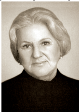
Г. К. Васильева

ВАСИЛЬЕВА Галина Кузьминична (03.06.1914, Воронеж — 13.12.1987, Пермь), актриса театра, заслуженная артистка РСФСР (1965). В 1934—1937 актриса Воронежского драматического театра. В 1937—1946 актриса Куйбышевского драматического театра. В 1946—1987 актриса Пермского областного драматического театра. В июле 1986 выступала в Челябинске. В 1957—1987 председатель правления Пермского отделения ВТО. Награждена орденом Трудового Красного Знамени, медалями. Лит.: Спектакли пермяков... // ВЧ. 1986. 1 июля.