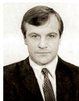
Ю. А. Вожakov

ВОЖАКОВ Юрий Александрович (05.02.1959), советский хоккеист. До 1981 играл в горьковском «Торпедо». В высшей лиге провёл 172 игры, забил 14 шайб. Бронзовый призёр юниорского чемпионата Европы (1977). Привлекался в молодёжную сборную СССР, в составе которой дважды становился чемпионом мира (1978, 1979). Перейдя в «Динамо» за девять сезонов (1981—1990) провёл 380 игр, забил 32 шайбы. 21.11.1985 в Челябинске в матче с командой «Трактор» забросил одну шайбу. Чемпион СССР (1990), серебряный призёр (1985, 1986, 1987), бронзовый призёр (1982, 1983, 1988). В 1983—1985 провёл 14 игр в составе сборной СССР. Участник Кубка Канады (1984). Победитель приза «Известий» (1982). В 1990 окончил МОГИФК. С 1992 работал в тренерском штабе ХК «Кур», в том числе с 05.10.1995 до конца сезона 1997/98 в качестве главного тренера. В 2002—2006 возглавлял «Ветцикон». В 2006—2011 тренировал «Хаскис», а в 2011—2013 — «Давос». Лит.: «Трактор» Челябинск : справочник / авт.-сост. В. А. Соколов. Челябинск, 1988.