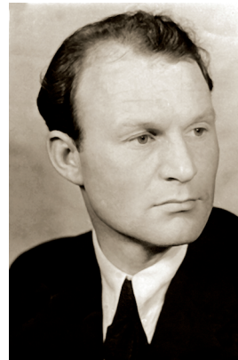
И. Д. Воронов

ВОРОНОВ Иван Дмитриевич (6(19).01.1915, с. Новый Милет (ныне Московской обл.) — 6.08.2004, Москва), советский актёр театра и кино, лауреат двух Сталинских премий 2-й (1946), 3-й (1950) степеней, народный артист РСФСР (1962). Учился в Театральном училище им. Вс. Мейерхольда. После второго курса был переведен в труппу театра им. Вс. Мейерхольда. После расформирования театра Мейерхольда играл в Госцентрозе, в 1942—1944 артист Комсомольско-молодёжного фронтового театра при Всероссийском театральном обществе, с 1944 служил в Центральном детском театре. Снимался в кино: «Опасные тропы» (1954), «Рассказы о Ленине» (1957), «Версия полковника Зорина» (1978), «Экипаж» (1979), «Михайло Ломоносов» (1986) и другие фильмы. Театральные работы: «Ревизор» Н. В. Гоголя — Ляпкин-Тяпкин; «Горе от ума» А. С. Грибоедова — Павел Афанасьевич Фамусов; «Мёртвые души» Н. В. Гоголя — Ноздрёв; «Город мастеров» Т. Г. Габбе — Караколь; «Два капитана» В. А. Каверина — Николай Антоно-