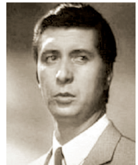
В. Л. Вуячич

ВУЯЧИЧ Виктор Лукьянович (11.07.1934, г. Харьков, УССР — 17.09.1999, г. Минск, Белоруссия), советский и белорусский эстрадный певец (драматический баритон), народный артист Белорусской ССР (1976). С 1942 с семьей в эвакуации на Алтае. Пел в хоре местного Дома культуры (г. Рубцовск). В 1953 был призван на службу в Военно-морской флот. Проходя службу на Балтике, солировал в ансамбле Краснознаменного Балтийского флота. В 1957 переехал в Минск, работал солистом Белорусского государственного народного хора, в 1959—1961 — артистом хора Белгостелерадио. В 1962 окончил Минское музыкальное училище им. М. И. Глинки. С 1963 выступал в ансамбле песни и пляски Белорусского военного округа, с 1966 —