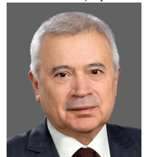
В. Ю. Алекперов

АЛЕКПЕРОВ Вагит Юсуфович (01.09.1950, Баку), российский предприниматель и управленец, доктор экономических наук (1998), действительным членом Российской академии естественных наук, лауреат премий Правительства Российской Федерации в области науки и техники (1998, 2007), миллиардер. В 1972—1974 работал оператором по добыче нефти и газа производственного объединения «Каспморнефть». В 1974 окончил Азербайджанский институт нефти и химии по специальности «Горный инженер по технологии и комплексной механизации разработки нефтяных и газовых месторождений». В 1974—1979 работал старшим инженером-технологом районной инженерно-технологической службы № 2, начальником смены, мастером по добыче нефти и газа, старшим инженером, заместителем начальника нефтепромысла НГДУ им. А. Серебровского ПО «Каспморнефть». Работал в ПО «Сургутнефтегаз» Главтюменнефтегаза Министерства нефтяной промышленности СССР: старший инженер (1979), начальник (1979—1980) нефтепромысла № 2 НГДУ «Фёдоровскнефть»; начальник (1980—1981) Центральной инженерно-технологической службы НГДУ «Холмогорнефть»; главный инженер (с 1981), заместитель начальника (до 1983) НГДУ