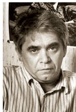
А. И. Гельман

Соч.: Премия. Москва, 1976; Обратная связь. Москва, 1978; Мы, нижеподписавшиеся. Москва, 1980; Наедине со всеми. Москва, 1983.