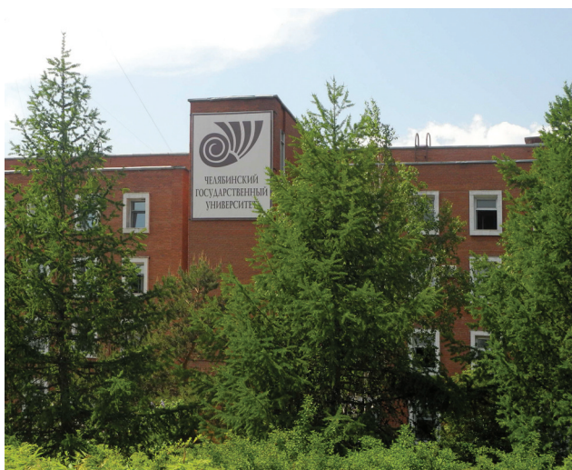
Фото: Е. С. Меньшенина

Ист.: Ильин, Арлен Михайлович // Википедия: свободная энциклопедия. URL: https://ru.wikipedia.org/wiki/Ильин,_Арлен_Михайлович .