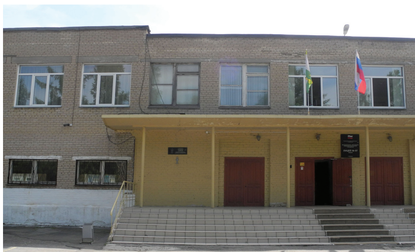
Фото: Е. С. Меньшенина

Ист.: Челябинск : энциклопедия. http://www.book-chel.ru .