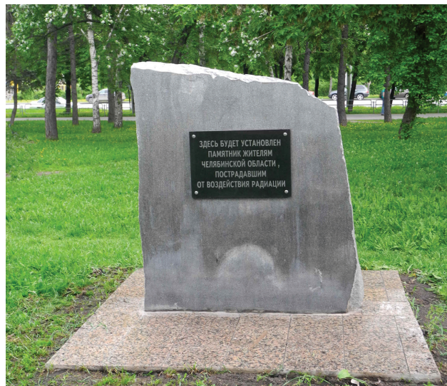
Фото: Е. С. Меньшенина

Ист.: В Челябинске построят памятник жертвам радиации // Медиазавод. URL: http://mediazavod.ru/shorties/130246 .