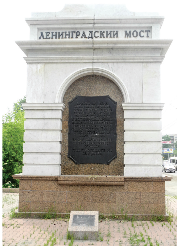
Фото: Е. С. Меньшенина

Ист.: Ленинградский мост // Карта74. URL: http://www.xn--74-6kca2cwbo.xn--p1ai/tourism/sights/leningradskiy_most .