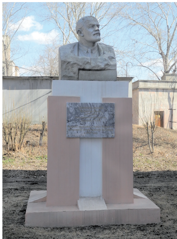
Современный памятник В. И. Ленину