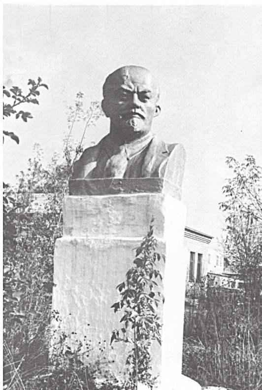
Первый памятник В. И. Ленину в Копейске

ОПИСАНИЕ: Копейский городской округ, улица Борьбы, дом 34. НАДПИСЬ: «Ульянов (Ленин) Владимир Ильич (1870—1924), государственный деятель, создатель СССР. Первый памятник в городе Копейске установлен по инициативе шахтёров в 1925 году». Памятный знак размещен рядом с поликлиникой городской больницы № 1.