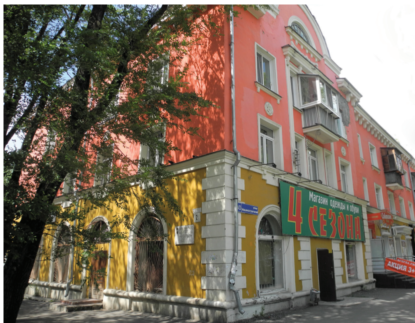
Фото: В. Б. Феркель

Ист.: Челябинск : энциклопедия. URL: http://www.book-chel.ru .