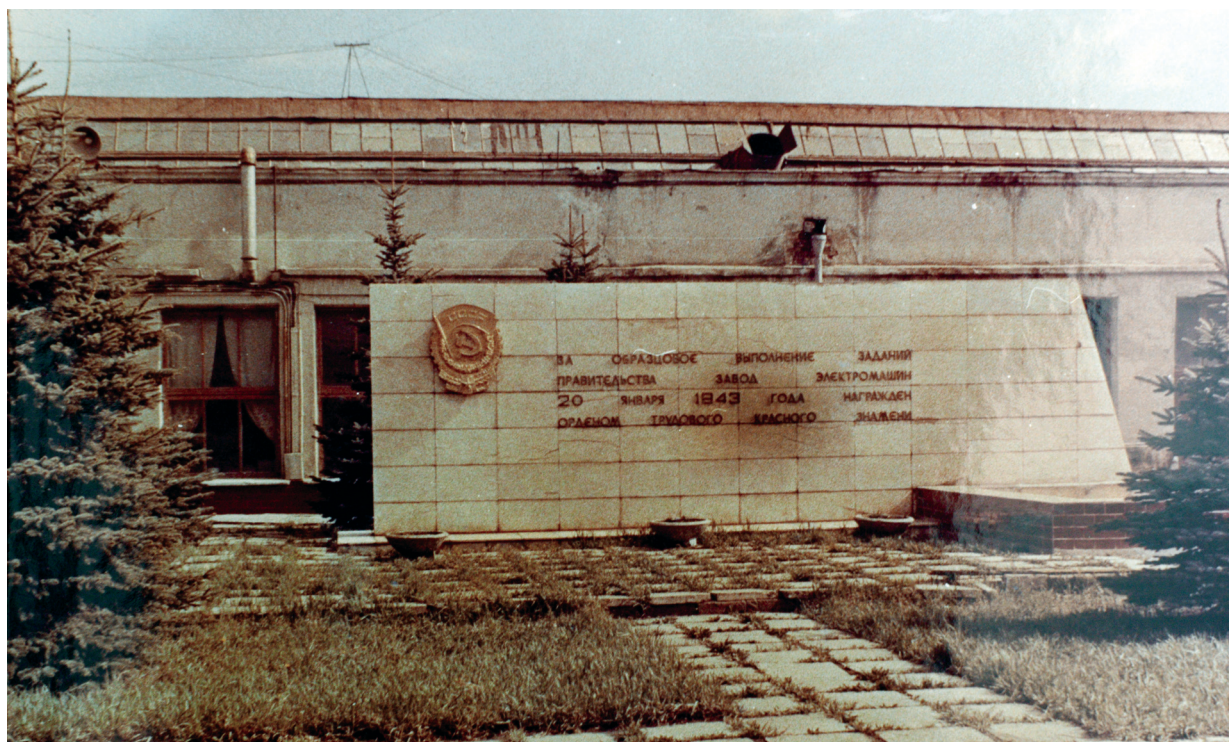
Фото: Е. Клавдиенко

Исм.: http://chelindustry.ru/view2.php?idd=65&tr=1 .