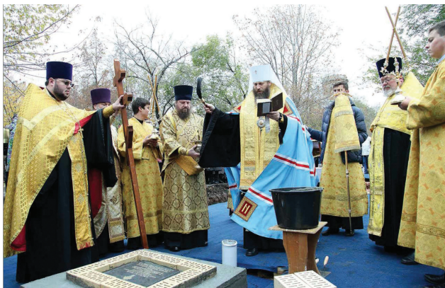
Фото: пресс-служба Челябинской епархии, В. Б. Феркель

Ист.: https://ru.wikipedia.org/wiki/Дмитрий_Иванович_Донской .