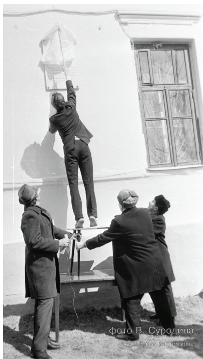
Мемориальное здание