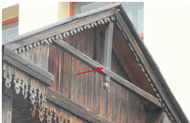
ул. Кирова, 118

Несущие элементы скатной крыши, поддерживающие основание кровли.