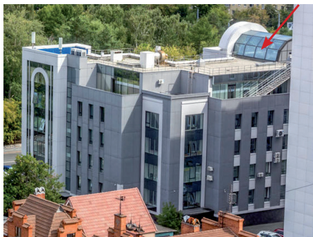
ул. Коммуны, 131