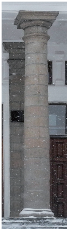
ул. Кирова, 116

Архитектурно обработанная круглая или многоугольная в сечении вертикальная опора, элемент несущей конструкции зданий и архитектурных ордеров. Состоит из фуста (ствола), капители и базы .