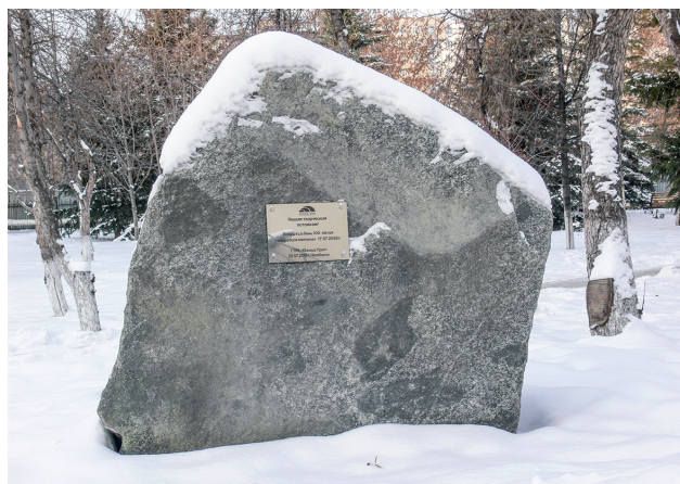
Фото: А. Я. Нахтигаль

Ист.: https://www.cheltv.ru/o-nas/istoriya-gtrk-yuzhnyj-ural-shagi-texnicheskogo-progressa .