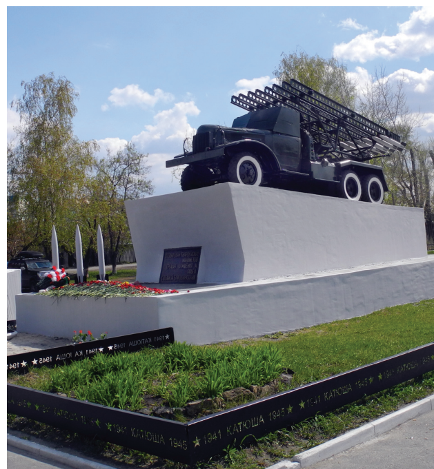
Фото: В. Б. Феркель

Ист.: БМ-13 («Катюша») // Парковый комплекс истории техники им. К. Г. Сахарова. URL: http://museum.vaz.ru/about-exhibits/stati/2-bm-13 ; http://ssgen.livejournal.com .