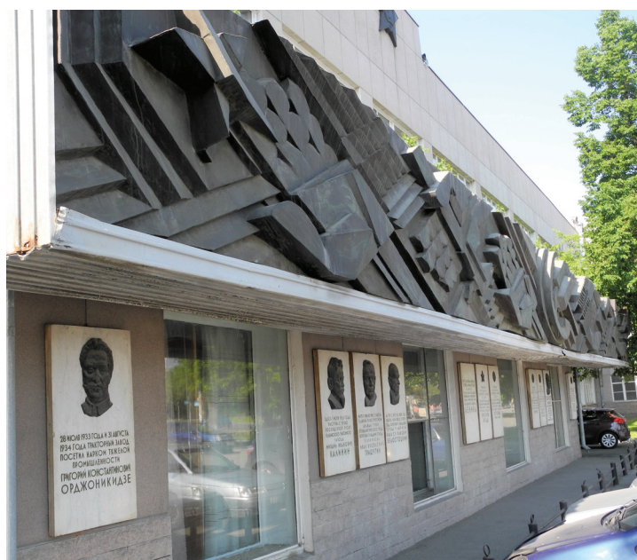
Современный вариант мемориальной доски