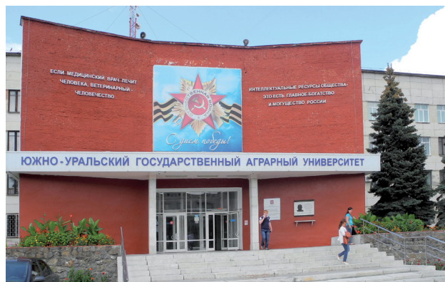
Фото: Е. С. Меньшенина, И. В. Стоякин

Ист.: Троицк : энциклопедия. Челябинск : Каменный пояс, 2013.