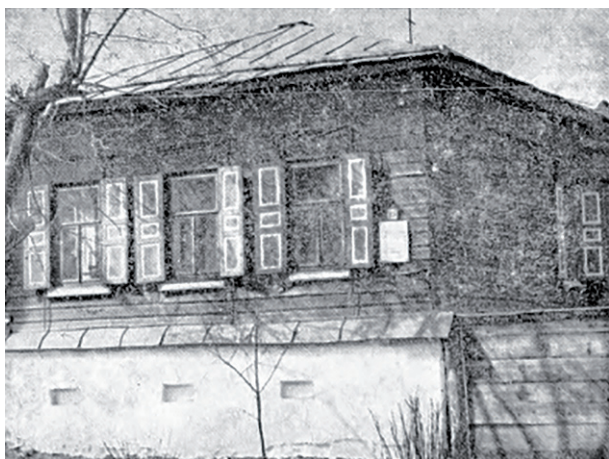
Фото: архив; В. Б. Феркель

Ист.: Троицк : энциклопедия. Челябинск : Каменный пояс, 2013.